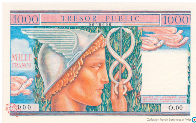
Collection French Banknotes of War

Fayette : VF35.2, Pick : M12s, Schwan-Boling : 842s. Billet avec le « tampon rouge ».