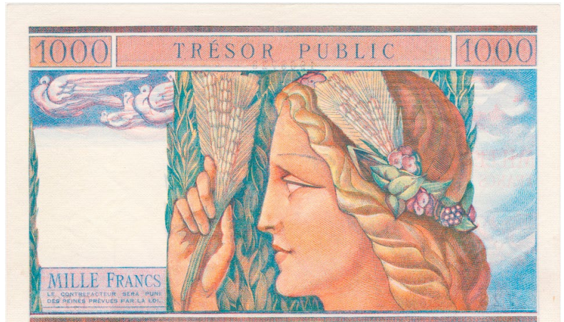
Collection French Banknotes of War