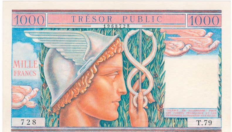
Collection French Banknotes of War